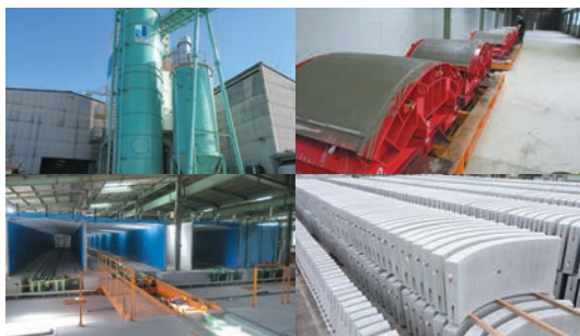
セグメント製造ライン(熊谷工場)