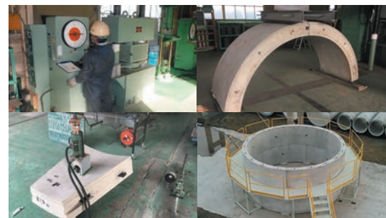
各種試験・検査体制