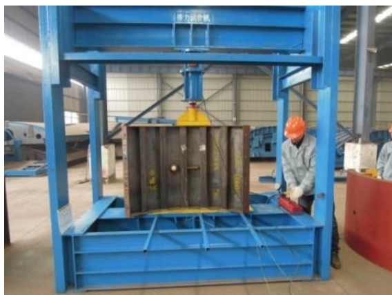
ジャッキ推力試験