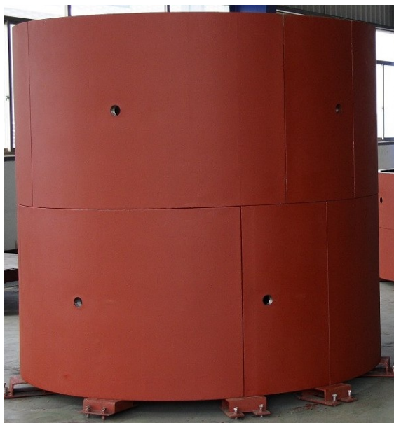
鋼製セグメントの水平仮組状況