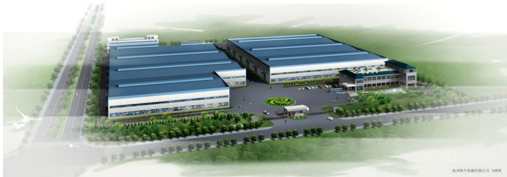
認定工場 杭州鉄牛機械有限公司

2013 年より、日本国内においても、この認定取得を契機に中国で製造する鋼製セグメントを日本のシールド工事に適用すべく営業を開始するとともに、RCセグメントを含めたセグメント事業全般に進出する方針です。