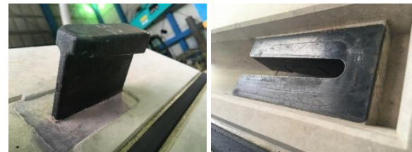
写真1 T型金物(左)、C型金物(右)